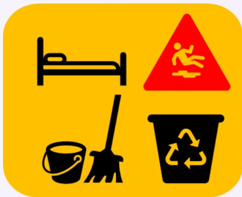
Pisos mojados o deslizantes Camas sin freno o elevadas