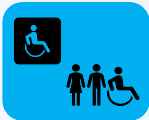
Falta de acompañamiento